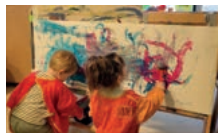
L'éveil artistique et culturel du jeune enfant : repères et ressources pour agir